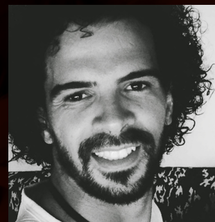
ANDRÉ VAROGH DISTRIBUIÇÃO